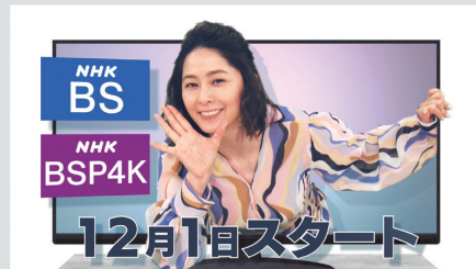
NHKアナウンサー 杉浦友紀

2023年12月に番組改定を行い、「NHK BS」と「NHK BS プレミアム4K」がスタートします。 新しい衛星2波は、2K・4Kそれぞれの特性を生かしたコンテンツを柔軟に編成し、地上波では味わえない新たな価値を創造します。